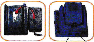
۱. ورودی سیم بلندگو ۲. ورودی سیم میکروفون

میکروفون دستگاه بایک بست روی مقرنصب میشود. برای نصب آن کافیسست پولکی پشت میکروفون را در حفره بست منطبق کرده و با حرکت به سمت داخل ، سپس قسمت پایین آن را در محل خود قرار دهید .